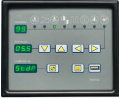
KULLANIMI KOLAY DİJİTAL GÖSTERGE